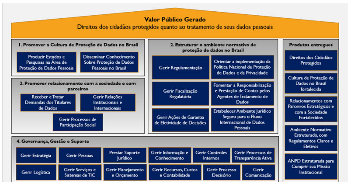
Figura 1: Macroprocessos ANPD

assegurar a efetividade das decisões fiscalizatórias; e) interpretação normativa e participação social ; f) promoção da responsabilização e prestação de contas pelos agentes regulados; g) regulação e avaliação de transferências internacionais de dados pessoais ; h) recepção e tratamento de demandas de titulares, incidentes de segurança e denúncias ; e i) articulação institucional e internacional .