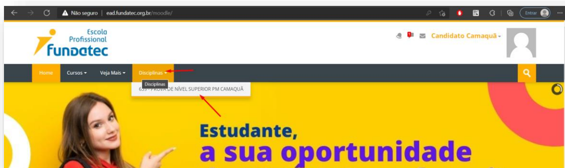
Figura 2 - Passo 3 clicando em disciplinas

Clique em “disciplinas” e depois na prova que deseja realizar.