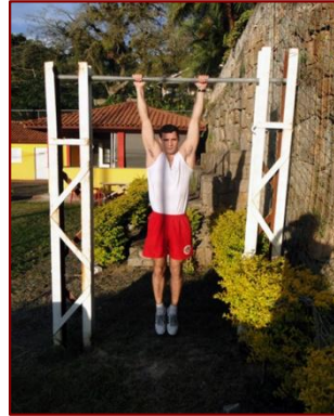
POSIÇÃO 0 (INICIAL)