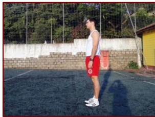
POSIÇÃO 4 (FINAL)

.4. Voltar à posição inicial, para completar o exercício (posição “quatro”).